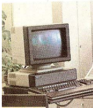
Рачунар ТИМ 011

У основној верзији ТИМ 011 има 256 килобајта RAM-а и додатна 32 KB видео меморије која је смештена у I/O мапу микропроцесора. При раду са текстом на екрану се исписује 80 карактера у сваком од 24 реда, а графичка резолуција је 512*256 тачака уз четири нивоа сиве боје. Као спољна меморија користи се двострана 80-трачна флопи диск јединица од 3,5 инча која обезбеђује упис 780 килобајта података на дискету [16].